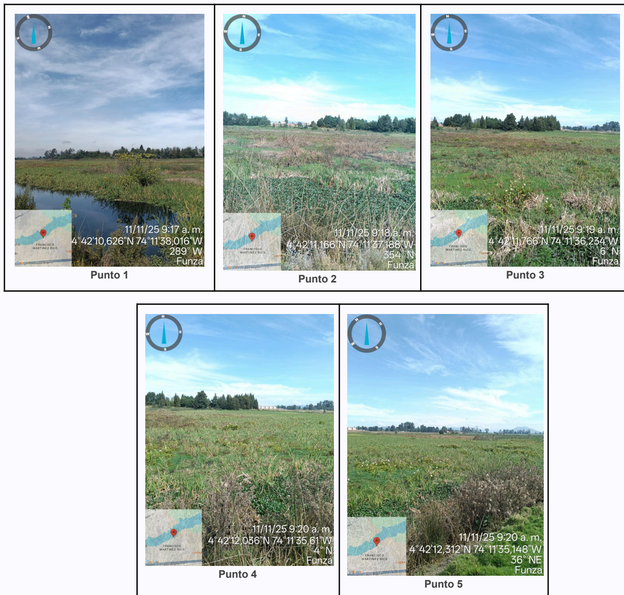
Ilustración 2. Fotos de los puntos del Recorrido de Control Y Vigilancia Ronda Del Humedal Gualí.